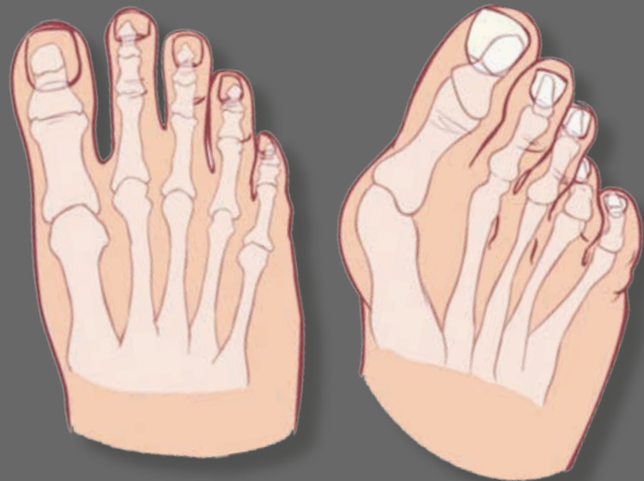
Links een gezonde voet, rechts een voet met hallux valgus.